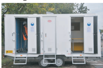
Table 6 personnes 3 tabourets + 1 banc coffre Bloc cuisine : réchaud 2 feux gaz Évier avec pompe à eau électrique Chauffe-gamelle Réfrigérateur double énergie gaz/électricité Radiateur à gaz Chauffe-eau instantané à gaz Éclairage LED temporisé (alimenté par panneau solaire) Réserve eau propre 200 litres Réservoir eaux usées 200 litres 1 prise électrique 220V (si raccordement réseau) Armoire à pharmacie- Tableau affichage Extincteur poudre ABC 2kg Tableau d'affichage