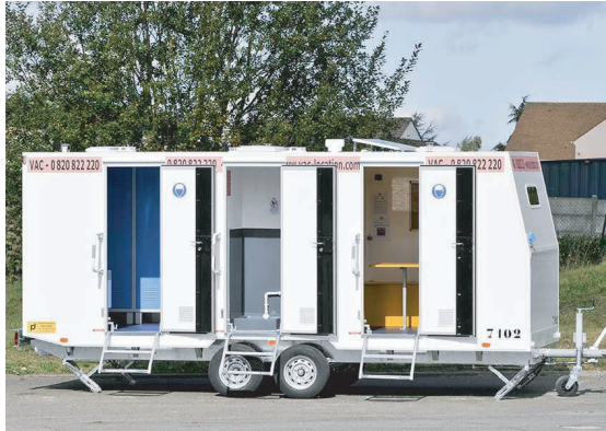
Plan type : la configuration et certains équipements peuvent varier selon les bases de vie

Réfectoire 8 places Sanitaire, Vestiaires, Douche, Panneau solaire (existe avec armoires vestiaires séchantes : B8DVS) (existe aussi en 3 largeurs : B8D210, B8D230, B8D250)